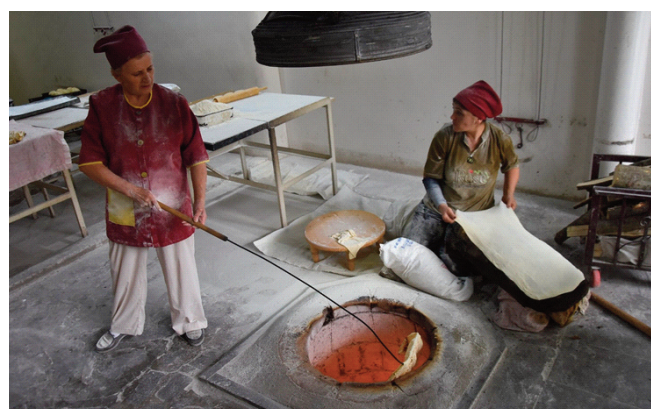
Pekárna – tradiční chléb lavaš