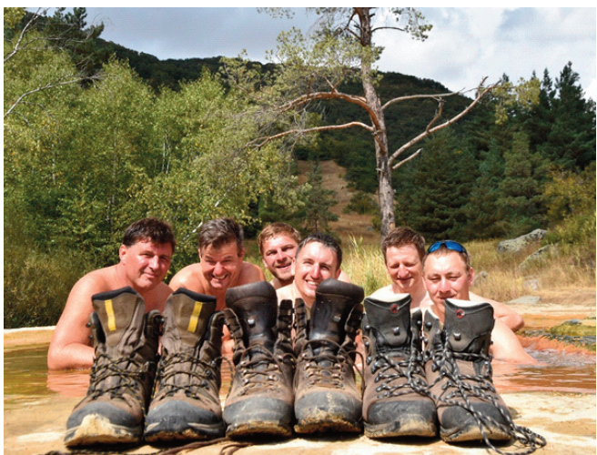
Jermuk – minerální prameny