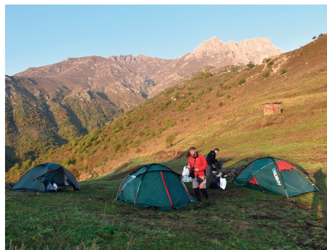
Kapan – výstup na Khustup (3 201 m)