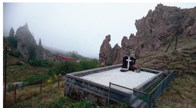
Skalní město v Goris