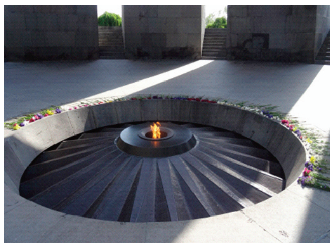
Památník genocidy v r. 1915