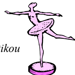
obr. č. 2

Odpovězte na otázky a rozhodněte, která disciplína se danou problematikou zabývá: