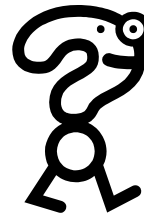
obr. č. 3